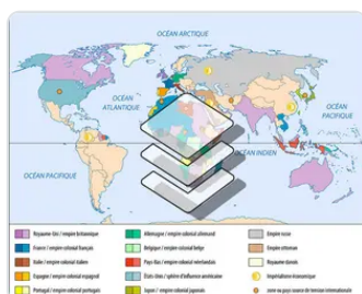
L'Europe et le monde e... Encyclopædia Universalis Fr...

En dépit de la stabilité très apparente des empires coloniaux, de 1914 à 1918, la Première Guerre mondiale ouvre des brèches dans l'édifice colonial. Il y a bien un nouveau partage du monde, les vainqueurs profitant des dépouilles des vaincus ; il y a une nouvelle vague d'exaltation de l'idée coloniale (comme en témoigne l'Exposition coloniale internationale de 1931 à Paris) et aussi quelques flambées expansionnistes : l'Italie occupe l'Abyssinie, et le Japon, qui est entré dans le cercle des puissances coloniales, consolide sa mainmise sur une partie de la Chine. On voit des « colonies », telles l'Union sud-africaine, la Nouvelle-Zélande et l'Australie, recevoir des mandats « coloniaux ». Cependant, les mouvements de libération nationale