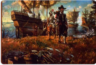
Jamestown et la coloni...

Le cas de l'Allemagne est un peu différent. Elle est devenue un État unifié et une puissance économique alors que le partage du monde était déjà très avancé. Dans ces conditions, les compagnies privées présentaient pour Bismarck de grands avantages. Elles coûtaient à l'État moins cher que la colonisation officielle et risquaient moins (car on pouvait toujours les désavouer) de provoquer des conflits avec les autres puissances coloniales. Ainsi trouvons-nous, à l'origine des colonies africaines de l'Allemagne, des compagnies à charte.