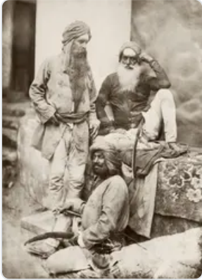
Révolte des cipayes

plus lente. Les assemblées révolutionnaires avaient maintenu l'Exclusif. Il disparaît pour les Antilles et la Réunion le 3 juillet 1861, et la libération des échanges s'étend bientôt à l'ensemble des territoires coloniaux. Pour ses colonies de peuplement, l'Angleterre s'oriente vers le self-government .