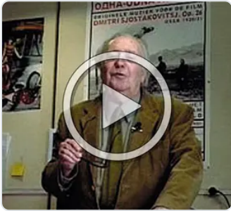
Colons et colonisés, M... Encyclopædia Universalis Fr...